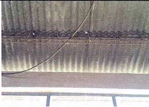
Foto1: El techo del modulo 1 del establecimiento requiere sustitucion