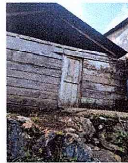
Foto 6: se observa la cocina a un costado de la escuela en mal estado.

Observación: Si es necesario se pueden agregar hojas adicionales y actualizar el número de hojas.