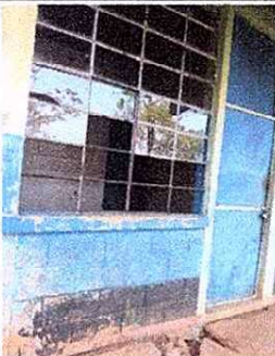
Foto 5: La paredes del establecimiento muestra el deterioro de pintura